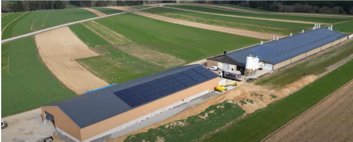
Abbildung 7: im Vordergrund Lagerhalle mit 336 m 2 Kollektorfeld und im Hintergrund die Masthalle mit einer 200 kWp PV- Anlage

Es konnten bisher folgende Optimierungspotentiale festgestellt werden.