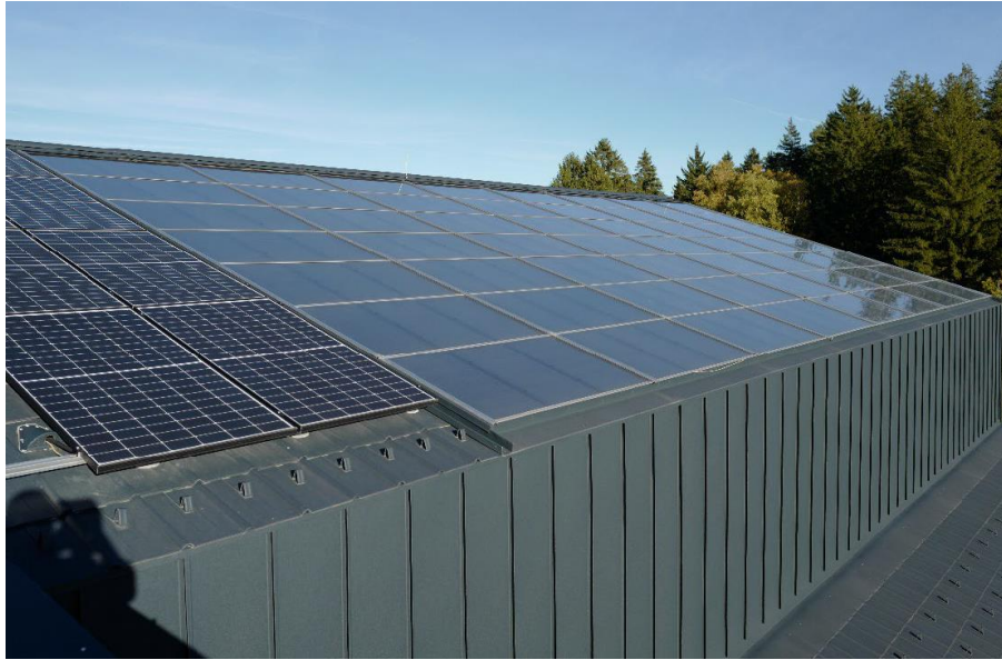
Abbildung 5: Südwestliches Luftkollektorfeld mit insgesamt 114,5 m 2 Kollektorfläche und ein Teil der 17 kWp PV- Anlage am Ziegenstall

Es konnten bisher folgende Optimierungspotentiale festgestellt werden.