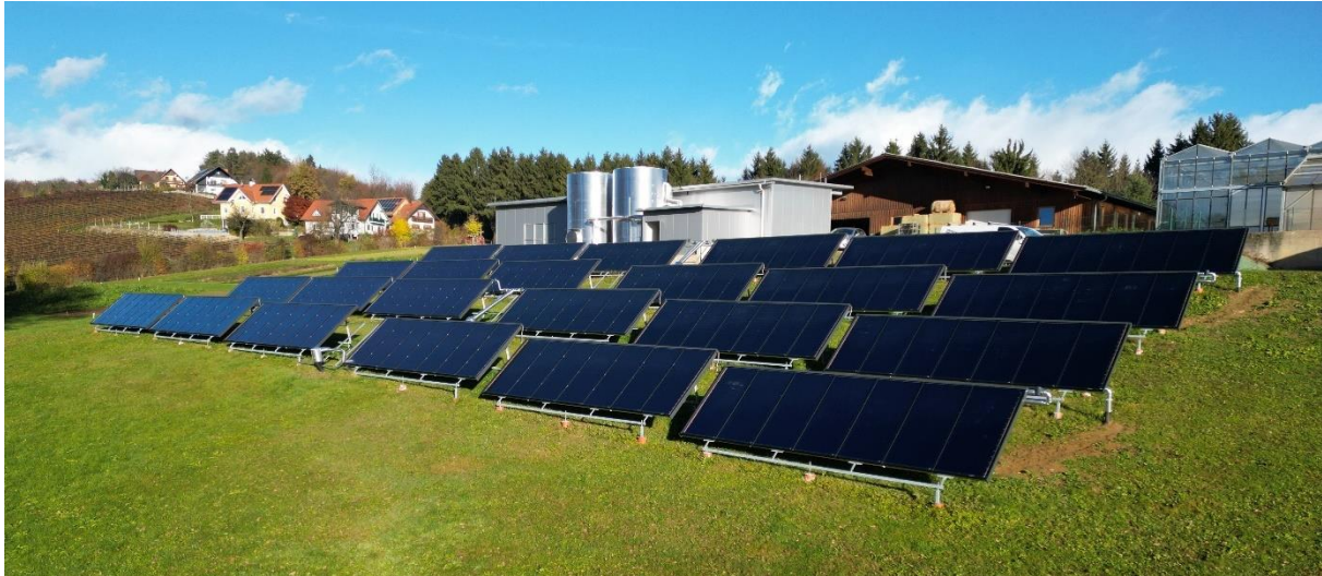
Abbildung 6: installierte Solarthermie-Anlage

Es konnten bisher folgende Optimierungspotentiale identifiziert werden: