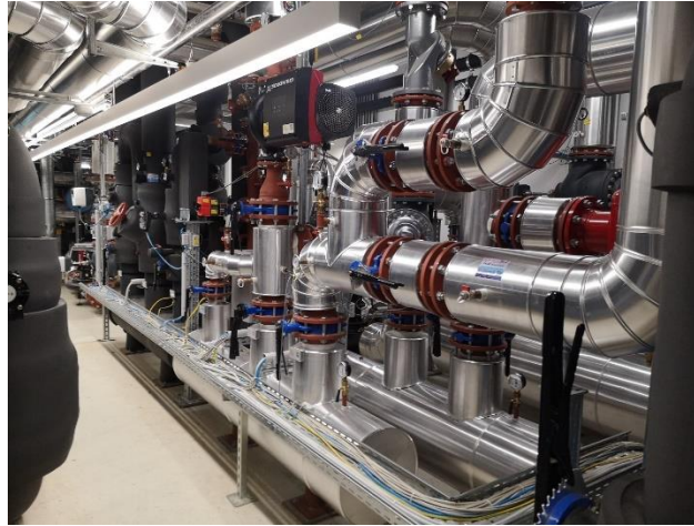
Abbildung 4: Anlagentechnik im Betriebsraum

Es konnten bisher folgende Optimierungspotentiale identifiziert werden: