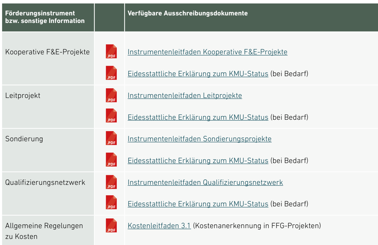
Tabelle 6: Ausschreibungsdokumente – Förderung

Hinweis: Die eidesstattliche Erklärung zum KMU-Status ist für Vereine, Einzelunternehmen und ausländische Unternehmen notwendig. In der zur Verfügung gestellten Vorlage muss – sofern möglich – eine Einstufung der letzten drei Jahre lt. KMU-Definition vorgenommen werden.