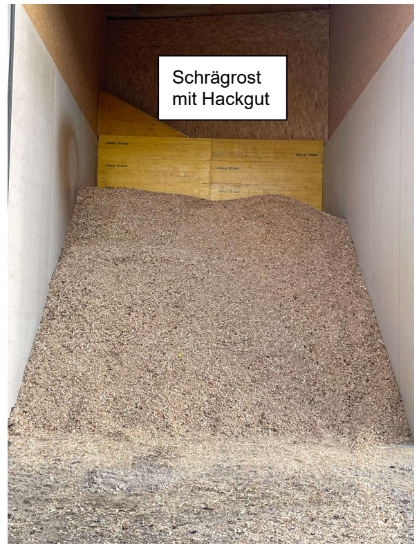
Schrägrost mit Hackgut