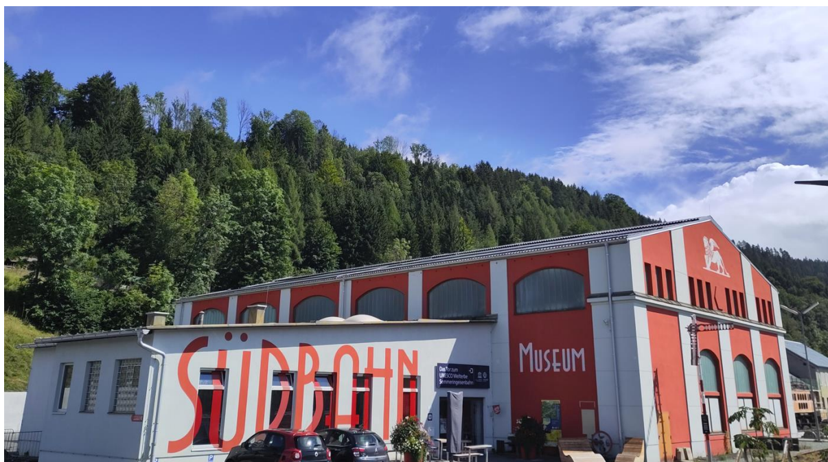
Abbildung 2: Außenansicht der Ausstellungshalle

Vor dem Hintergrund des hohen Alters der Bestandsheizungsanlage, der relativ hohen Heizlast eines denkmalgeschützten, historischen Industriebaus und einem hohen energieträgerbasierten CO 2 -Ausstoß wurde für das Projekt folgendes Ziel gesetzt: Die Umsetzung einer klimafitten, zukunftssicheren Heizungsanlage, welche das SÜDBAHN Museum zuverlässig mit Raumwärme versorgen kann.