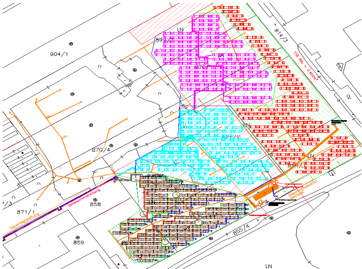
Abbildung 1: Projektstandort mit Kollektorfelderweiterungen

Das Gelände für die neue thermische Solaranlage befindet sich auf der Deponie nahe der Maggstraße im Süd-Osten von Graz. In Abbildung 1 ist der Projektstandort ersichtlich. Ausbaustufe 4 der thermosolaren Anlage ist als grünschraffierter Bereich mit rot gefärbten Kollektoren gekennzeichnet. Die Kollektoren der bestehenden Anlage sind in Schwarz, Türkis und Magenta abgebildet.